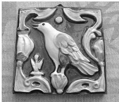
Ярославская майолика «Поющий соловей».