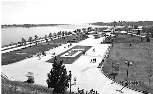
Стрелка. Место слияния двух рек – Которосли и Волги

Майская поездка в Ярославль хотя и была для меня пятой, в сущности оказалась первой. Заумный философский парадокс? Ничуть, скорее – бытовой. Первые четыре были, строго говоря, не поездками, а заездами: на полтора, два, самое большее – три часа. Представление о городе